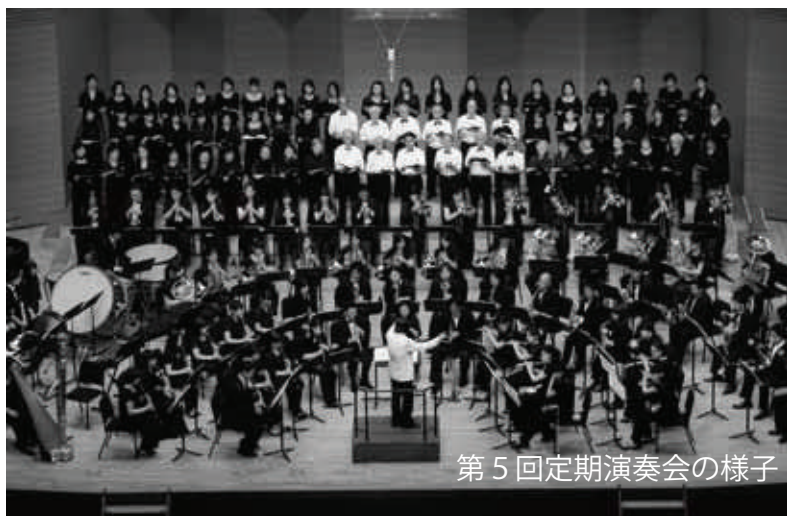
第5回定期演奏会の様子

10代～50代まで68名（2011年3月現在）の団員が所属し、主に定期演奏会他の自主公演、コンクール等吹奏楽連盟行事への参加、地域行事での依頼演奏等の活動をしています。